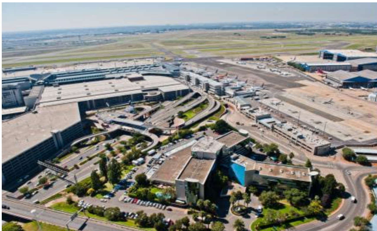
约翰内斯堡奥·坦博国际机场

洲大陆28个城市，飞往193个国家和地区的1,356个目的地，由于经营效率低下，该公司自2012年至今一直处于亏损状态，南非政府于2019年12月5日宣布南非航空公司进入破产保护程序。自2019年1月3日起，约翰内斯堡-北京航线变更为约翰内斯堡-深圳-北京。