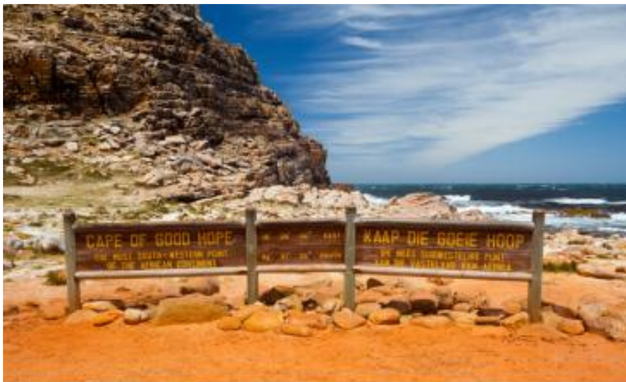
南非著名景点——好望角