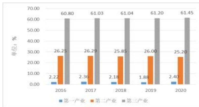
图 2-3: 2016-2020 年南非第一、二、三产业占 GDP 比重

近年来，南非第一、二、三产业占GDP比重较为稳定。2016-2020年，南非第一产业占GDP比重约为2%，第二产业约占26%，第三产业约占62%。其中，2020年第一、二、三产业占GDP比重分别为2.4%、25.2%和61.45%。近五年南非三大产业占比情况如下图所示：